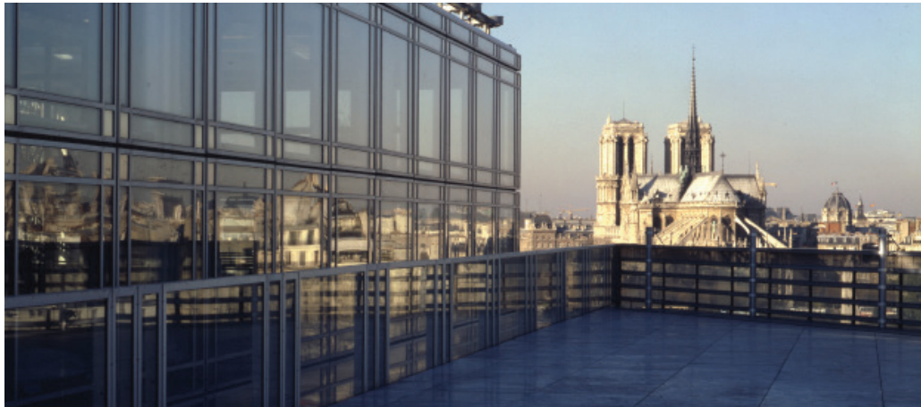
Fig. 4

En plein cœur de Paris, face à l'Île Saint Louis, l'Institut du Monde arabe entretient un rapport dialectique à plusieurs aspects contextuels entre le vieux Paris et l'exemple remarquable d'architecture moderne de la Faculté de Jussieu. À l'extrémité Est du Boulevard Saint Germain, l'institut suture un tissu urbain mixte et trône sur les rives de la Seine. Le projet a pour ambition de représenter la culture arabe sur le territoire français et d'offrir une interprétation symbolique de l'histoire entre ces deux civilisations. Conçu comme un lieu d'expositions dédié à l'art et la civilisation arabes, il regroupe un musée, des salles d'exposition, une médiathèque et un auditorium de 350 places.