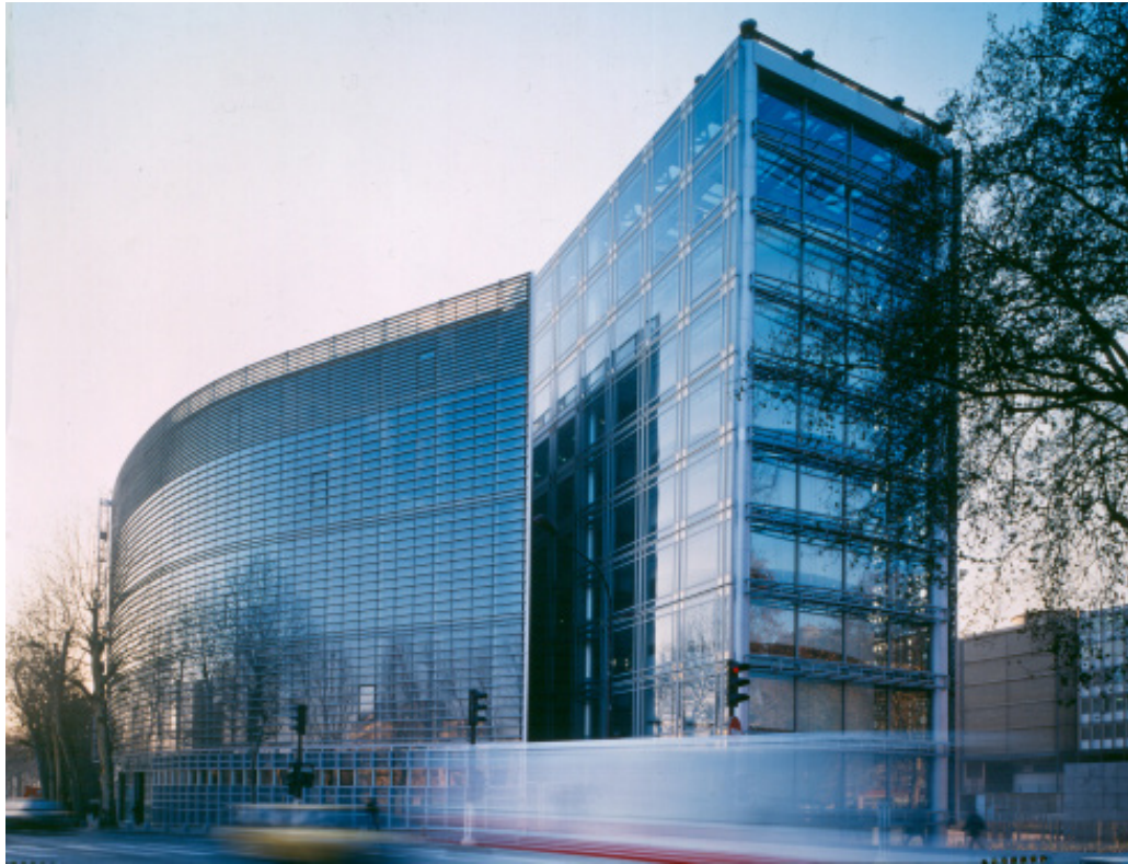
Fig. 1

L'Institut du Monde Arabe s'inscrit dans un contexte hybride et sert de transition entre un tissu historique et un urbanisme plus moderne. Son architecture iconique, de verre et d'acier, en a fait l'un des bâtiments les plus célèbres du monde grâce à une interprétation contemporaine et technologique du moucharabieh traditionnel.