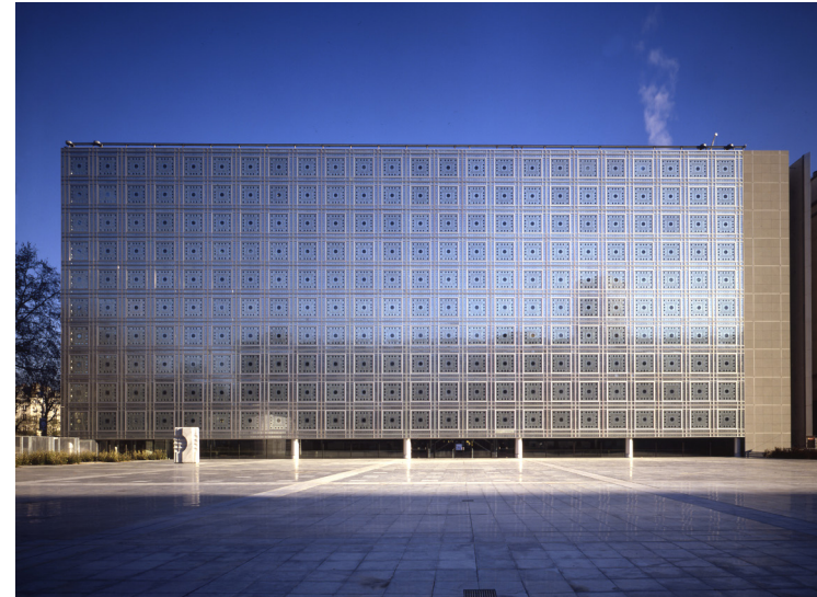
Fig. 2

L'Institut du Monde Arabe s'inscrit dans un contexte hybride et sert de transition entre un tissu historique et un urbanisme plus moderne. Son architecture iconique, de verre et d'acier, en a fait l'un des bâtiments les plus célèbres du monde grâce à une interprétation contemporaine et technologique du moucharabieh traditionnel.