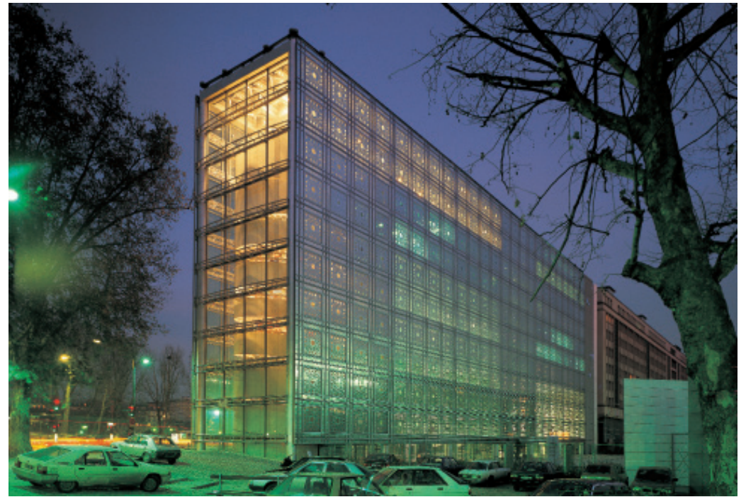
Fig. 5

En plein cœur de Paris, face à l'Île Saint Louis, l'Institut du Monde arabe entretient un rapport dialectique à plusieurs aspects contextuels entre le vieux Paris et l'exemple remarquable d'architecture moderne de la Faculté de Jussieu. À l'extrémité Est du Boulevard Saint Germain, l'institut suture un tissu urbain mixte et trône sur les rives de la Seine. Le projet a pour ambition de représenter la culture arabe sur le territoire français et d'offrir une interprétation symbolique de l'histoire entre ces deux civilisations. Conçu comme un lieu d'expositions dédié à l'art et la civilisation arabes, il regroupe un musée, des salles d'exposition, une médiathèque et un auditorium de 350 places.