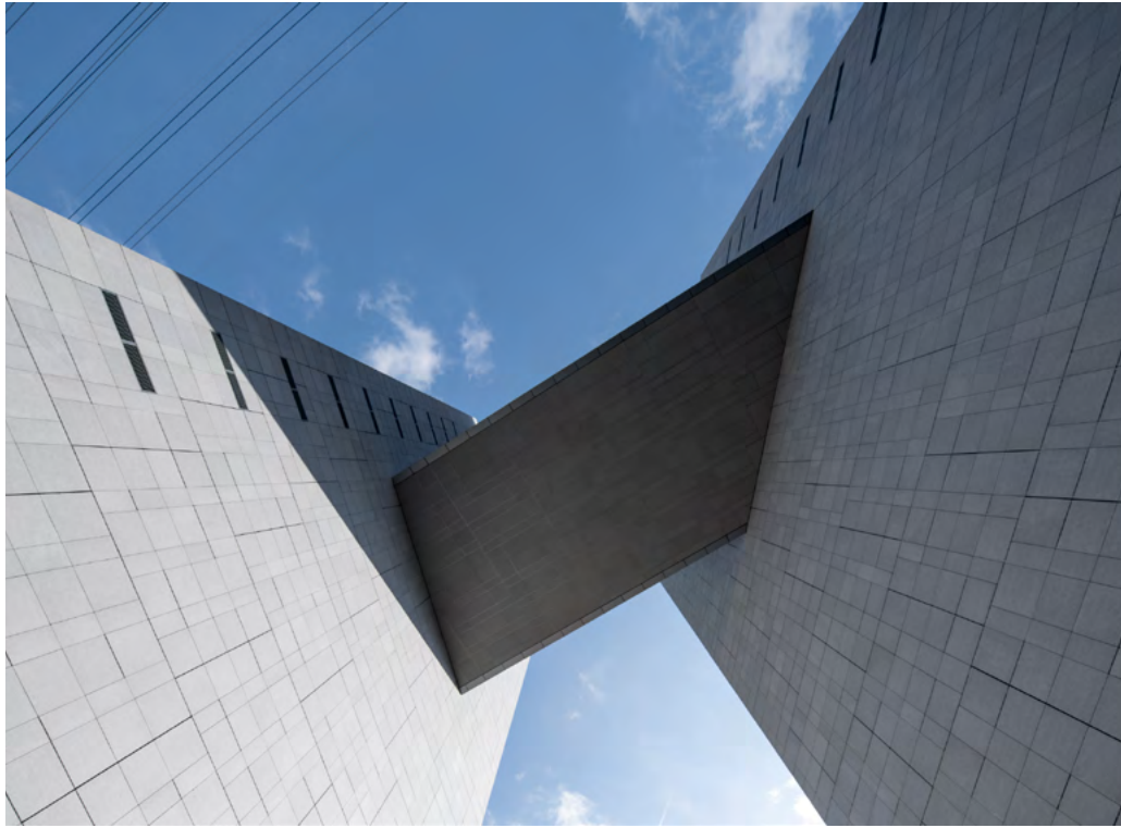
Fig. 3

Le concept du parc comprend la zone de bureau et la zone d'habitation et de jardin autour. Le jardin traditionnel est considéré comme un endroit de relaxation et de recueillement. Il représente un monde naturel et idéal. Les deux éléments essentiels, l'eau (l'étang) et la montagne (la rocaille), illustrent l'équilibre parfait entre le Yin et le Yang. De même que le mur d'enceinte du jardin chinois, Architecturestudio souhaite utiliser les bâtiments de bureau comme paravent de protection du jardin. A travers la brèche indiquée sur le plan, le jardin d'intérieur peut être vu partiellement, cela créa une communication perspective. Le concept de la dimension et le concept du paysage sont mis en avant dans ce projet. Ces bâtiments dont la hauteur maximum aboutie à 100 mètres ne sont pas des immeubles individuels, mais des éléments indispensables du jardin. Ils se transforment en cadre d'une peinture. Avec la partie creuse où est l'entrée, le bâtiment en grandie prend la forme d'une voûte géante.