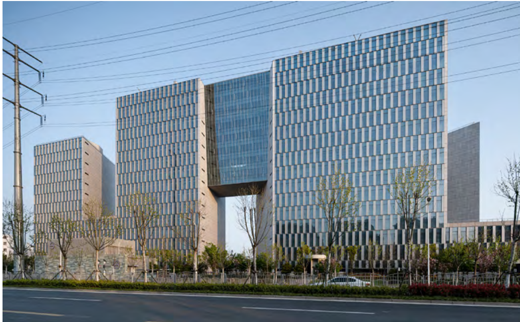
Fig. 1

Client : Jinqiao Group Équipe : Architecturestudio Lieu : Shanghai, Chine Programme : Parc Technologique Surface : 14.68 ha, dont 464 700 m 2 de surface bâtie Statut : Livré en 2020