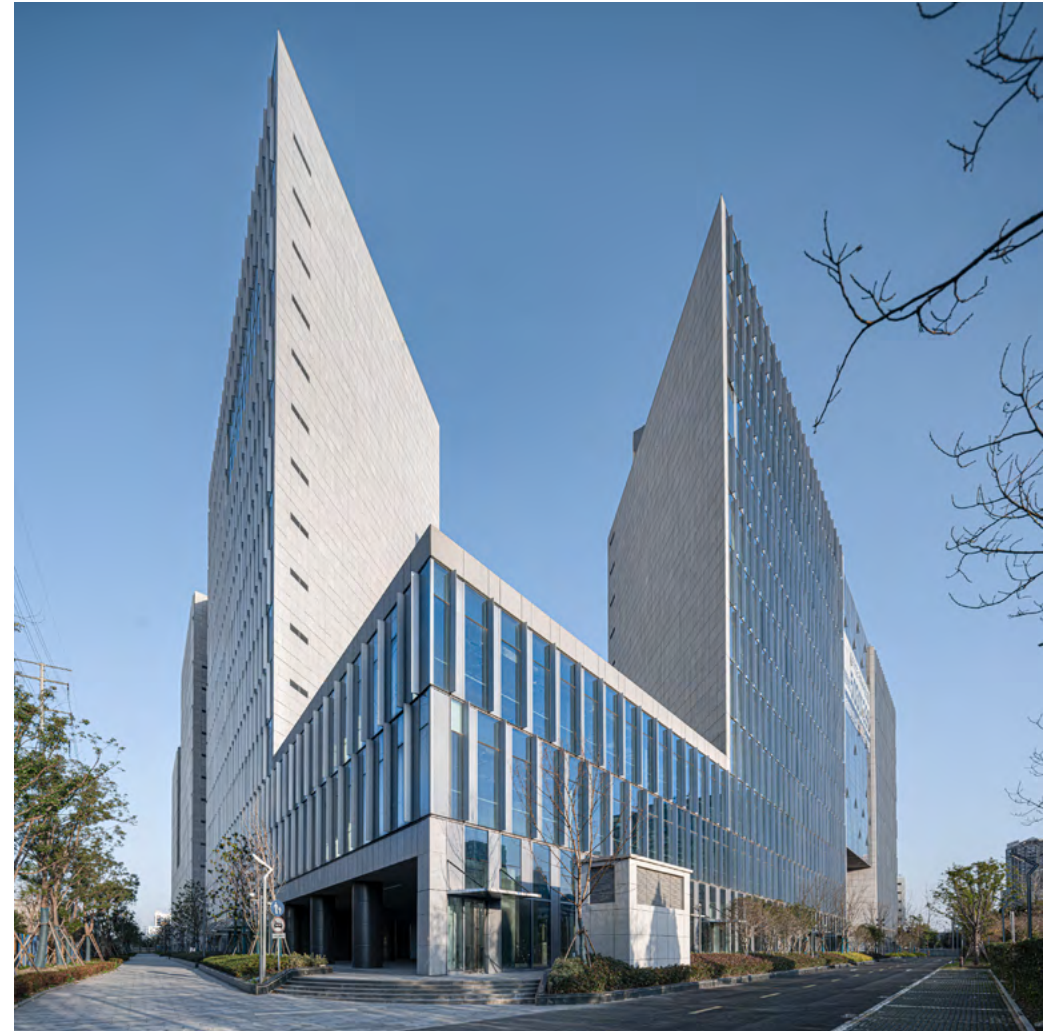
Fig. 4

Le concept du parc comprend la zone de bureau et la zone d'habitation et de jardin autour. Le jardin traditionnel est considéré comme un endroit de relaxation et de recueillement. Il représente un monde naturel et idéal. Les deux éléments essentiels, l'eau (l'étang) et la montagne (la rocaille), illustrent l'équilibre parfait entre le Yin et le Yang. De même que le mur d'enceinte du jardin chinois, Architecturestudio souhaite utiliser les bâtiments de bureau comme paravent de protection du jardin. A travers la brèche indiquée sur le plan, le jardin d'intérieur peut être vu partiellement, cela créa une communication perspective. Le concept de la dimension et le concept du paysage sont mis en avant dans ce projet. Ces bâtiments dont la hauteur maximum aboutie à 100 mètres ne sont pas des immeubles individuels, mais des éléments indispensables du jardin. Ils se transforment en cadre d'une peinture. Avec la partie creuse où est l'entrée, le bâtiment en grandie prend la forme d'une voûte géante.